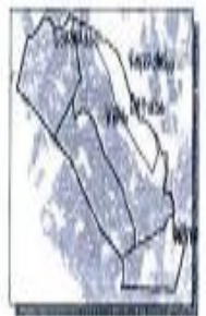
DISTRITO CIUDAD SOLIDARIDAD