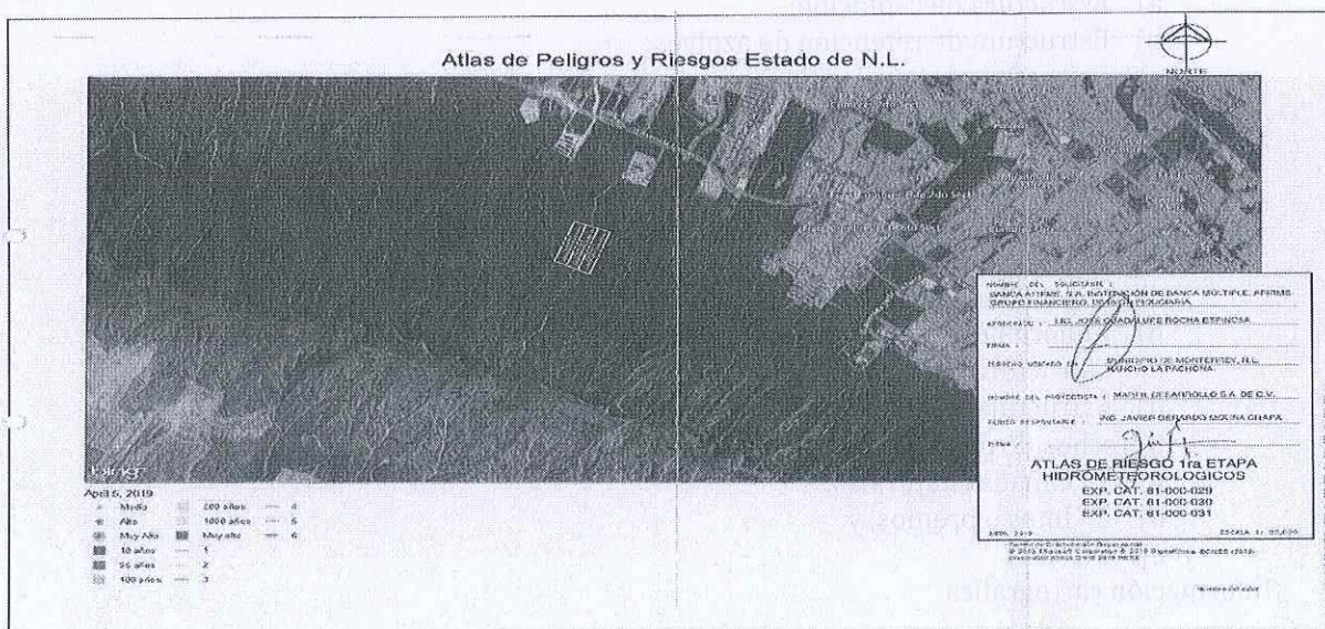
Captura de plano de riesgos hidrometeorológicos presentado por el promovente.

3. DRENAJE PLUVIAL: De acuerdo a plano presentado por el promovente y signado por el [REDACTED] 2 [REDACTED] en su carácter de apoderado legal, así como por el [REDACTED] 2 [REDACTED], en su carácter de perito Responsable, los predios con número de expediente catastral 81-000-029, 81-000-030 y 81-000-031 , No se encuentra en zonas de Riesgo Hidrometeorológico Muy Alto o encharcamiento en el visor del Atlas de Riesgo para el Estado de Nuevo León 1ª Etapa.