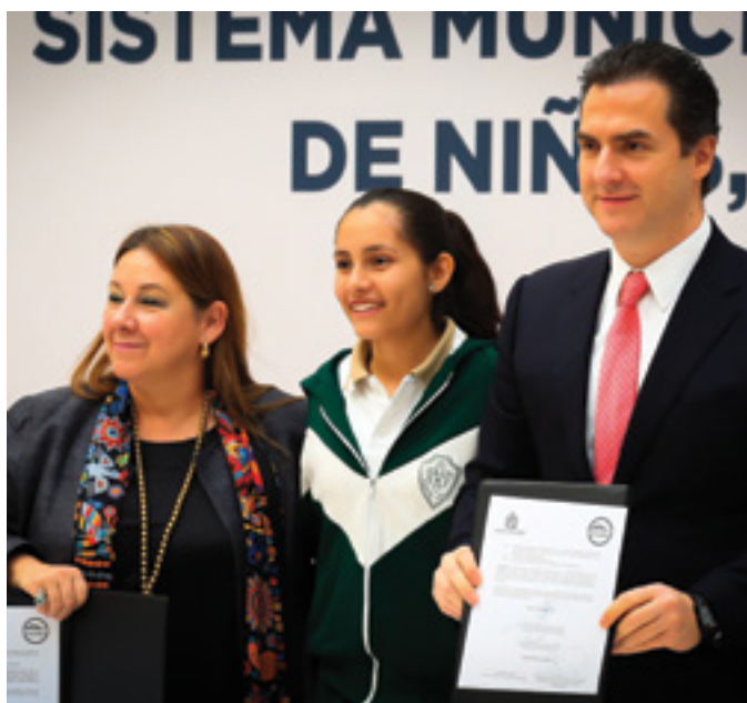
Sistema Municipal de Protección Integral de niñas, niños y adolescentes de Monterrey

En esta misma línea, el municipio de Monterrey fue investido con la Vocalía de Capacitación y Difusión de la Red Mexicana de Ciudades Amigas de la Infancia y Adolescencia, para el periodo 2016-2017. Esta Red, es una iniciativa global del Fondo de las Naciones Unidas para la Infancia (UNICEF), que promueve el desarrollo e incremento de programas municipales para la protección de la infancia y adolescencia; lo que enfatiza y demuestra el liderazgo y sensible compromiso del gobierno municipal en esta materia.