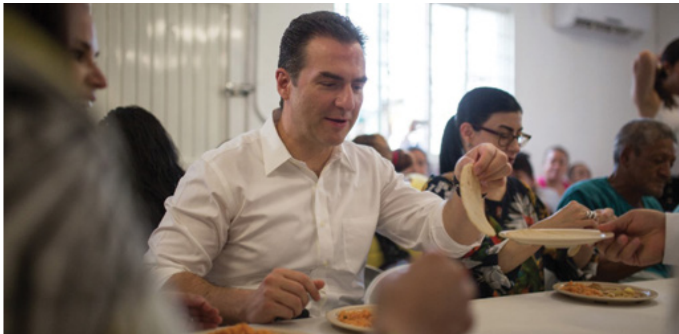
Comedor Comunitario La Gran Ciudad

En conjunto con la Secretaría de Desarrollo Social (SEDESOL) federal, el Gobierno Municipal puso en marcha el primer Comedor Comunitario de La Gran Ciudad en la Colonia Tierra y Libertad. El comedor ofrece 7 mil raciones de alimentos mensuales a habitantes de este sector. Próximamente, con una inversión de 4 millones de pesos, se pondrán en servicio dos comedores más en el sector San Bernabé y en la zona Altamira-Campana.