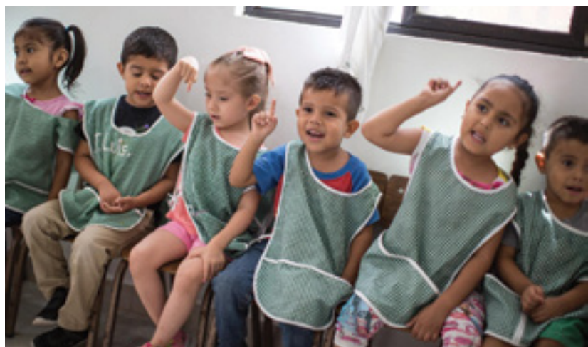
Niños en estancia Infantil

Así mismo, con la finalidad de apoyar a los padres de familia que trabajan y requieren un servicio de cuidado y atención infantil que les permita conciliar su vida laboral y familiar, se han beneficiado a 299 niñas y niños de 1 a 12 años de edad en promedio mensual, a través de siete Estancias Infantiles y dos Centros de Desarrollo Infantil, en donde los infantes recibieron atención médica, cuidados, educación, recreación, así como una sana alimentación, sirviendo a la fecha, un total de 109 mil 151 raciones de comida. Cabe mencionar que la actual administración rehabilitará próximamente las siete Estancias Infantiles y uno de los Centro de Desarrollo Infantil, con una inversión total de 7.3 millones de pesos.