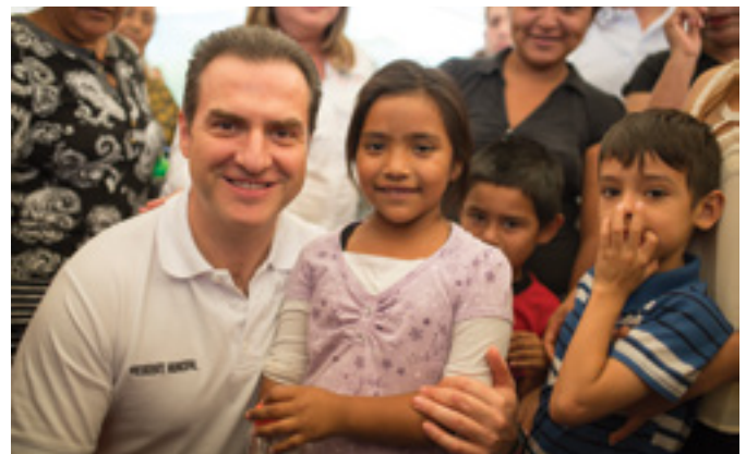
Junta de Vecinos