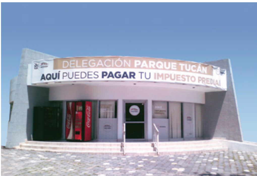
Centros de Atención Municipal (CAM)