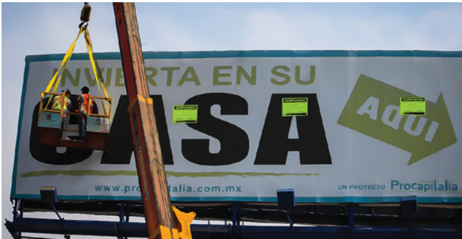
Operativo de regulación de anuncios panorámicos

tecnologías en publicidad visual. Como parte de este programa se han realizando operativos diarios para el retiro continuo de pendones y anuncios en postes; también se llevaron a cabo operativos de regulación de formatos de gran escala, en el que se han suspendido 200 anuncios publicitarios entre panorámicos, puentes peatonales, muppies, etcétera, que presentaban diversas irregularidades.