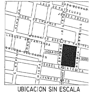
UBICACION SIN ESCALA